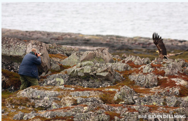
Stundtals klarar sig en fågelfotograf med kort tele ...