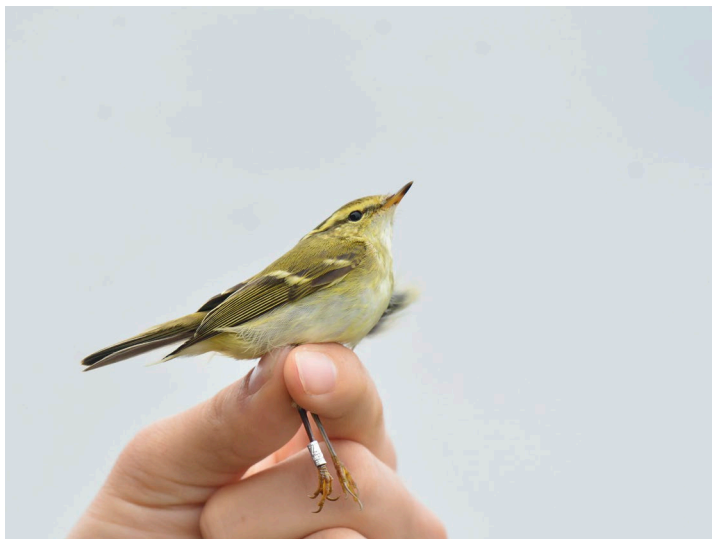
Tajgasångare – höstens karaktärsart!