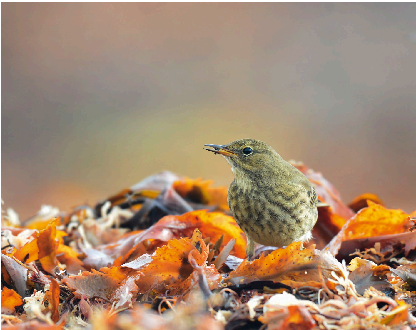
Rastande skärpiplärkor är extra välkomna för den som oftast spanar vid ostkusten.