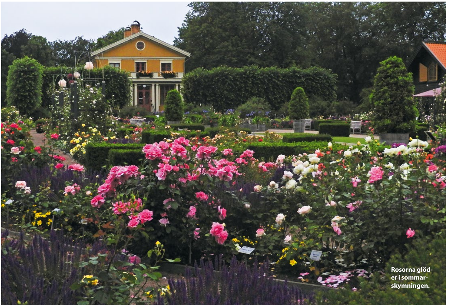
Rosorna glöder i sommarskymningen.