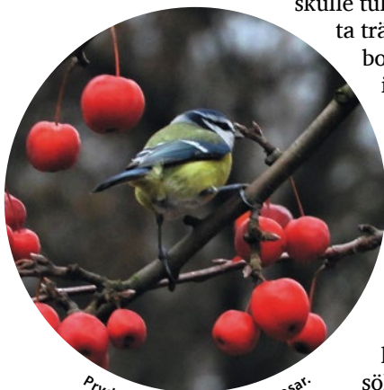
Prydnadsäpplen lockar blåmesar.

Fåglar som uppskattar gräsmattor och vad som finns där trivs här. De får stå ut med människor