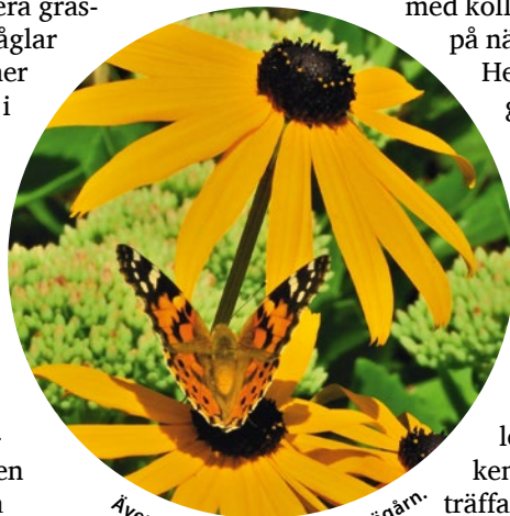
Även tistelfjäril kan landa i Trägårn.

Detta är som alla vet en mycket vacker park. Vad gäller blomster och fjärilar är parken vid rätt årtid svår att överträffa med sin rosenträdgård och sina blommande kamelior. Här trivs cafégäster, joggare och resenärer som väntar på nästa tåg. Efter 178 år finns parken fortfarande kvar. Numera är inträdet slopat, alla får komma hit. Vi lever i en ny tid med en större jämlikhet mellan människor. Och jag har fått en ny favoritpark. Välkommen också du. 🌱