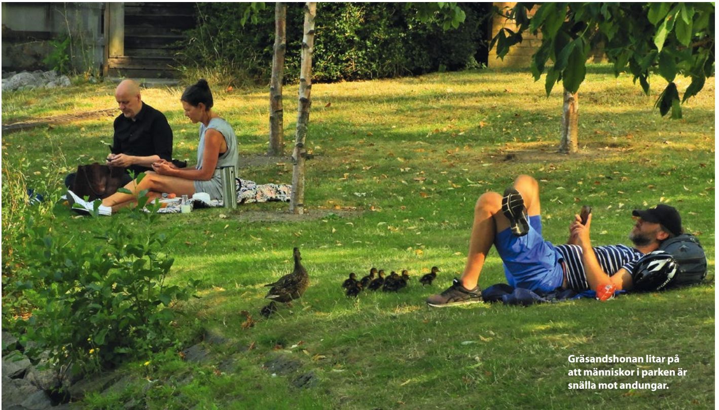
Gräsandshonan litar på att människor i parken är snälla mot andungar.