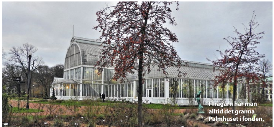
I Trägårn har man alltid det granna Palmhuset i fonden.