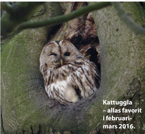
Kattuggla – allas favorit i februari-mars 2016.