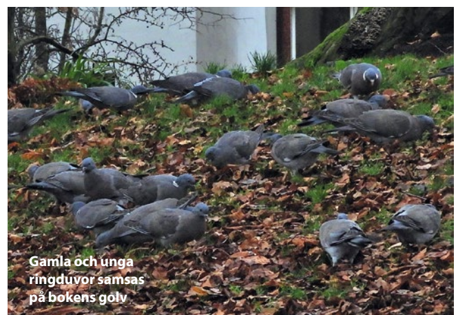
Gamla och unga ringduvor samsas på bokens golv