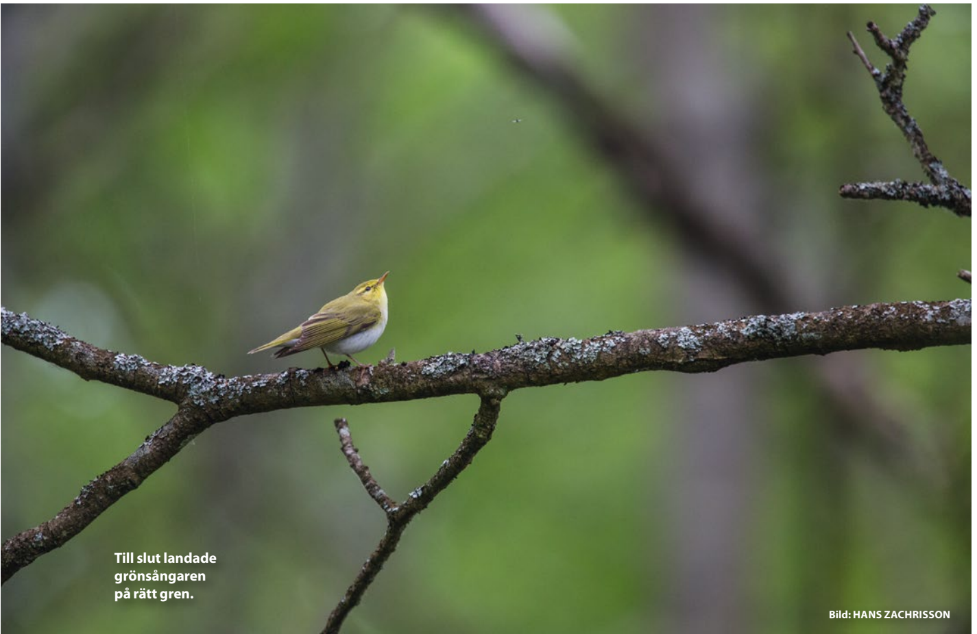
Till slut landade grönsångaren på rätt gren.