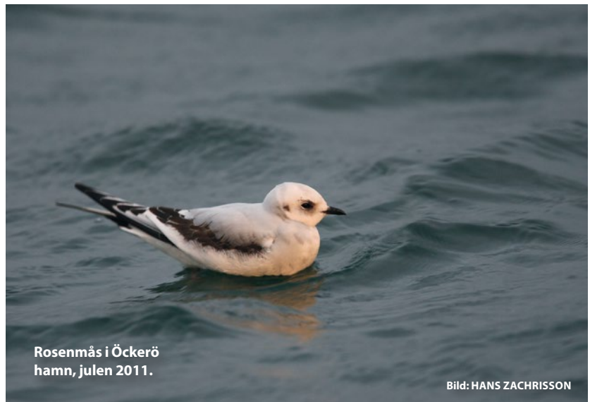
Rosenmås i Öckerö hamn, julen 2011.