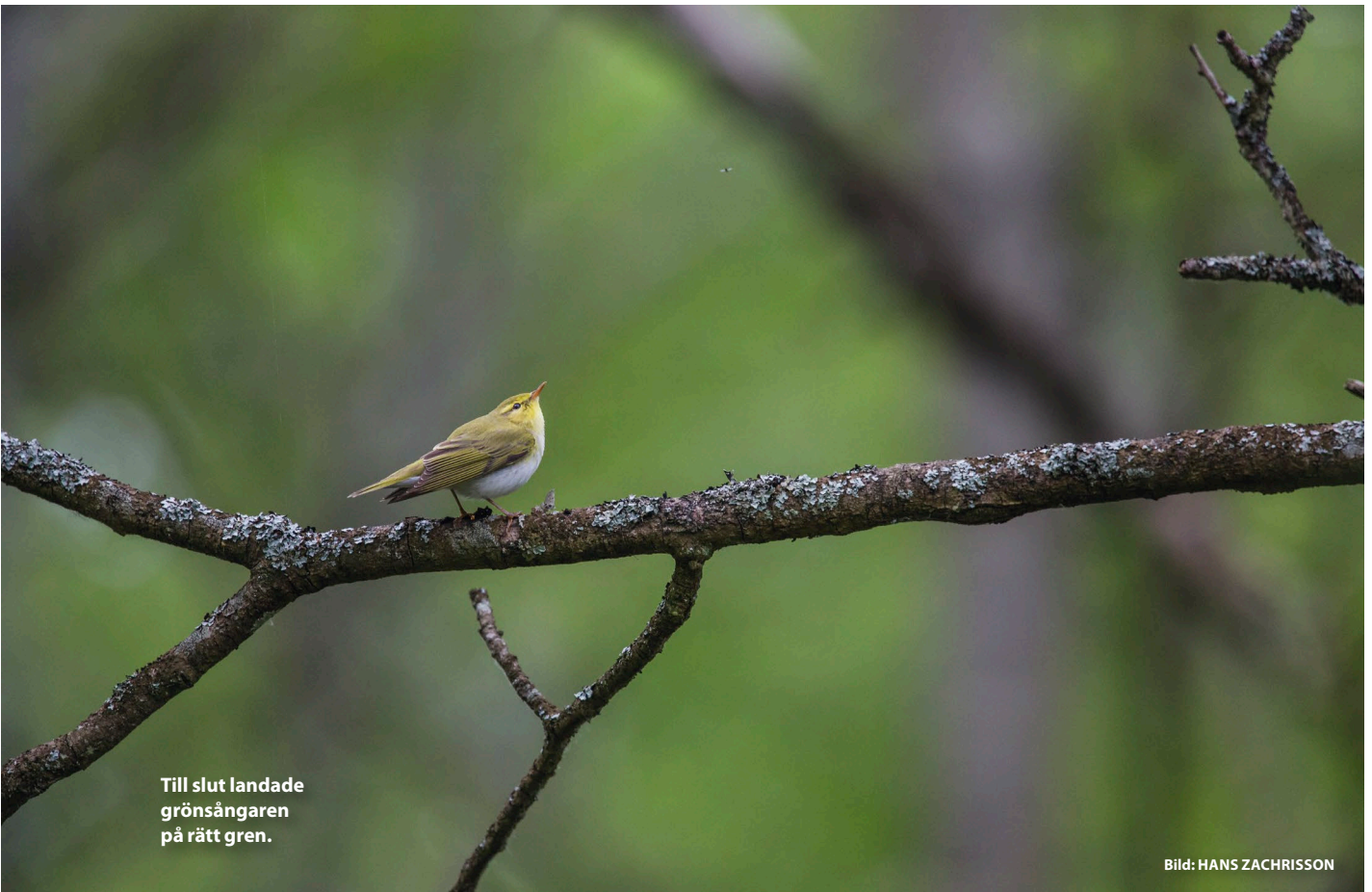
Till slut landade grönsångaren på rätt gren.