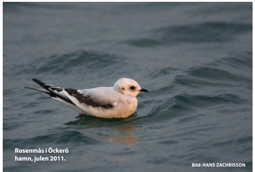
Rosenmås i Öckerö hamn, julen 2011.